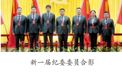
新一届纪委委员合影