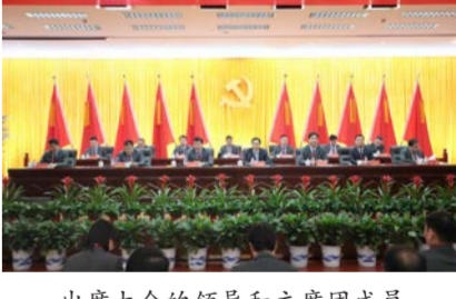
出席大会的领导和主席团成员