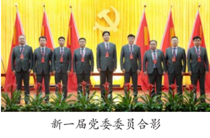
新一届党委委员合影