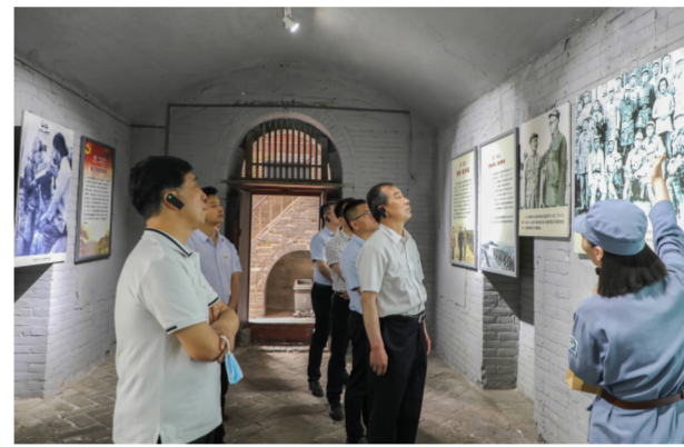
▲校党委赴豫西抗日纪念馆参观学习

5月25日上午,校党委理论学习中心组赴豫西抗日纪念馆参观学习,并于馆内会议室召开党史学习教育专题研讨会,重温军民团结抗日斗争的光辉历史,深切缅怀革命先烈为中华民族解放事业做出的巨大贡献。本次研讨会由校党委书记马书臣主持,校党委理论