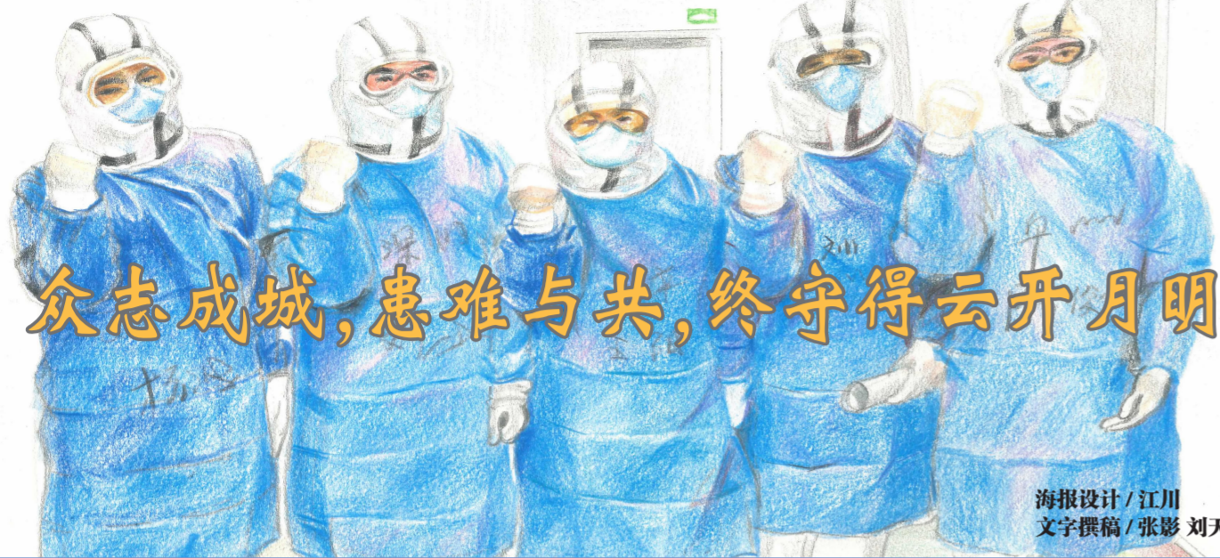
海报设计/江川 文字撰稿/张影 刘天旭 袁旭升 赵薇

编者按: 面对新冠病毒爆发后严峻的防控形势,郑州商学院的返乡教师、学生们主动请缨加入疫情防控的志愿者队伍,充分发挥青年人的光与热,做好党员的模范带头作用,为打赢这场疫情防控阻击战贡献郑商力量。