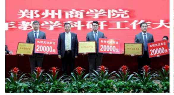
省教育厅韩冰处长为科研工作先进单位代表颁奖

吴校长指出,面对当前高等教育的形势和要求,要深刻认识到教学科研工作存在的问题和不足,既要研究政策、对标对表,又要坚持开放办学、凝练特色,在学习借鉴、博采众长的基础上,画准“自画像”,明晰“生态位”,找准促进我校高质量发展的“影响因子”,精准找出内涵建设的“显性指标”,在追求高质量的过程中“积极项”,全面协同发力,谋划发展举措,努力走出一条具有特色的高质量发展道路,全面提升办学水平和社会影响力;一要注重特色凝练,加强专业内涵建设。下大力气优化专业结构,做大做强商科专业,加快商科专业集群建设;要促进新文科背景下商科专业和非商科专业交叉融合;要积极深入行业、企业调研,务实开展深度合作,同步推进产业学院建设,促进共享共赢。二要深化教学改革,提升人才培养质量。加强教学改革落地落实、教学质量监控和保障、师德师风建设,注重三全育人,不断提升人才培养质量和办学水平。三要增强创新服务能力,提升科研工作质量。要紧紧围绕“三服务”科研工作方针,对标申硕和审核评估发展战略,提升科研项目质量,谋划