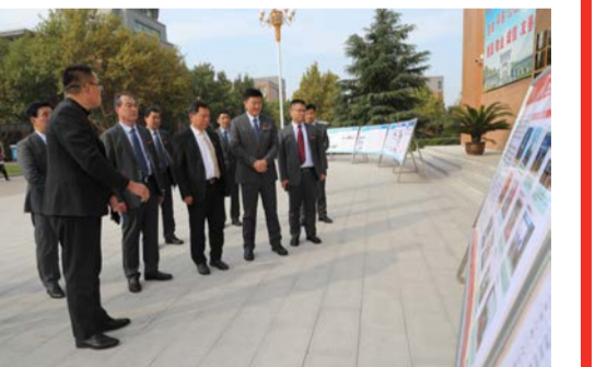
与会领导参观教学科研成果展